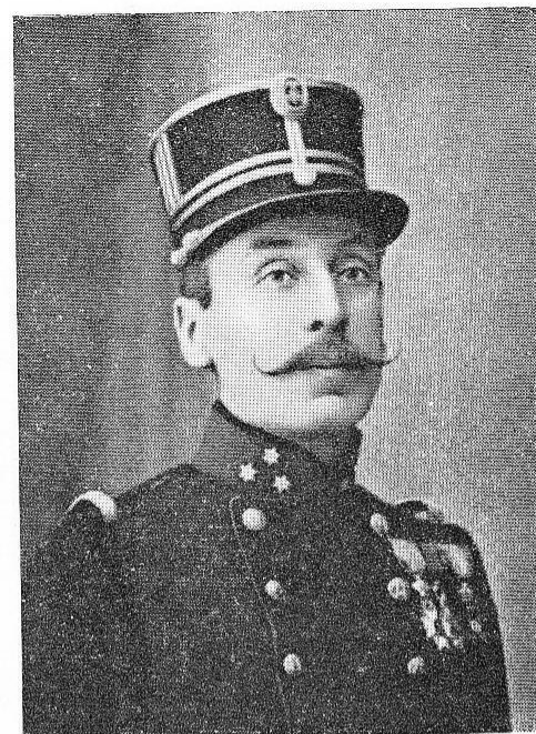
MAHIEU, Charles-François, né le 11 février 1869, à Mons. Capitaine-Commandant. O. de Léopold; O. Cour.; Cr. G.; Cr. Mil. 2 e cl.; M. Yscr. Tombé en héros, à Keyem, lors de la bataille de l'Yser, le 19 octobre 1914, et trouva une mort glorieuse, en continuant de combattre, malgré qu'il eût déjà été blessé à plusieurs reprises.

Blessé à Warnant, le 24 août 1914, fit preuve de brillantes qualités militaires et trouva la mort des braves à Furnes, suc- cumbant à ses blessures le 10 janvier 1919.