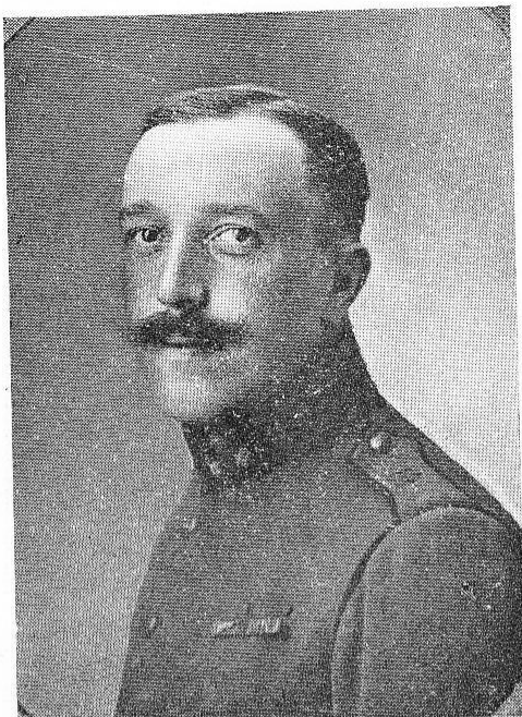
GILLES, Fern., né le 22 janv. 1883, à Chimay. Capitaine-Commandant. O. de Léopold; Ordre de la Couronne; Croix de Guerre. Chargé de prendre une position ennemie, en 1916, fut blessé au moment d'atteindre son but; retourné au front incomplètement guéri, vit ses blessures s'envenimer. Suc- comba, à Vinckem, le 28 septembre 1918.