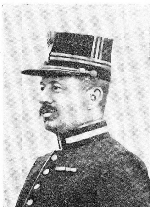
MAISTRIAUX, Aimé-François, né le 10 avril 1870, à Florennes. Capitaine-Commandant. Ord. Léopold; Ordre Couronne; Croix de Guerre; Croix Militaire de 2 e classe; Médaille de l'Yser. Ayant pris la tête d'une contre-attaque, à Oudstuyvekenskerke, le 24 octobre 1914, tomba héroïquement, frappé à mort par plusieurs balles ennemies.